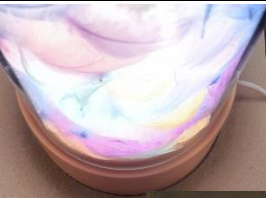
Museu de Barcelona

El Museu de Barcelona és un dels museus més importants del món. És un dels museus més visitats del món i és un dels museus més importants del món.