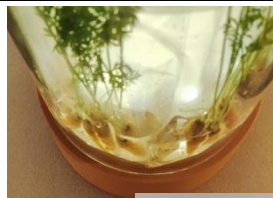
New Hidropòdic Jackie

Es tracta d'un projecte de llum que s'ha desenvolupat a partir d'un sistema senzill i sostenible. És un dels projectes més importants del món i és un dels projectes més importants del món.