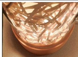
Controlador i la màgia dels filtres i el seu efecte

El projecte consisteix en desenvolupar un sistema senzill i sostenible que permeti controlar la llum i el seu efecte.