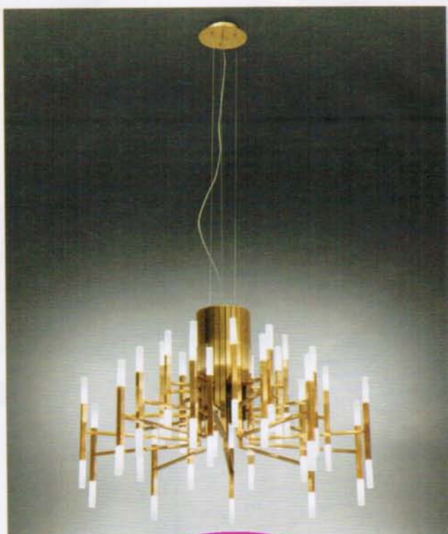
Thelight ALMA LIGHT

Las formas curvas del pájaro tropical con piernas largas y plumaje flamante prestan su nombre a esta nueva luminaria del diseñador Antoni Arola. A través de un exquisito trabajo de deconstrucción, Flamingo combina la funcionalidad con su apariencia poética, configurando espacios idóneos.